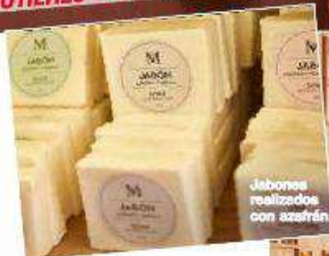
Jabones realizados con azafrán.

tienda dedicada en exclusiva al azafrán, donde descubrirás multitud de productos hechos con esta especia: jabones, cremas, mieles, chocolates, patés... De Madrid ¡al cielo! y un agujerito para verlo.