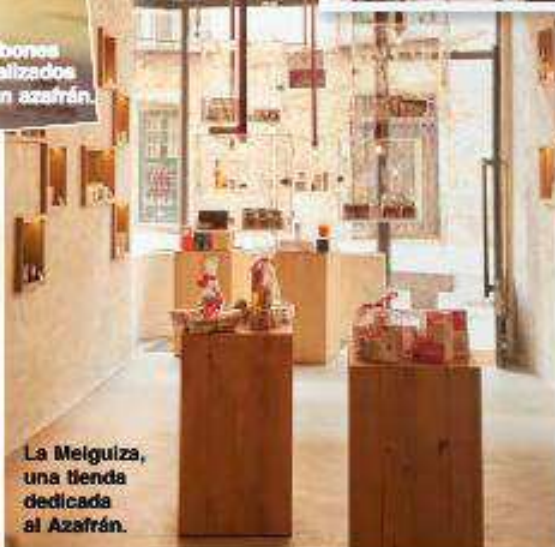
La Melguiza, una tienda dedicada al Azafrán.

(Más información: www.madridantifou.com )